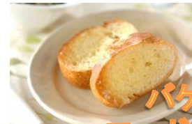
バケットのマーガリンサンド